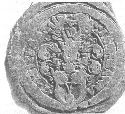
JANA KAVKA NA CEHNICI. 1563 (Č. 26) SOA Třeboň

Klenot: Dvě křídla en face, se čtyřmi pery bez vnitřní kresby, vystupují z boků prostředního listu koruny. Levé je rozmazané. Uprostřed je trojlíst, sedící na středním listu koruny. Je možné, že horní rozmazané listy zakrývají horní pera křídel. Listy jsou hruškovité a vnitřní kresba je tvořena U se špičkou směřující ke kulaté špičce listu. Řapíky tvoří dutý trojúhelník, jehož horní strana je nejdelší. Nad trojlístem je trojlístek patřící k opisu.