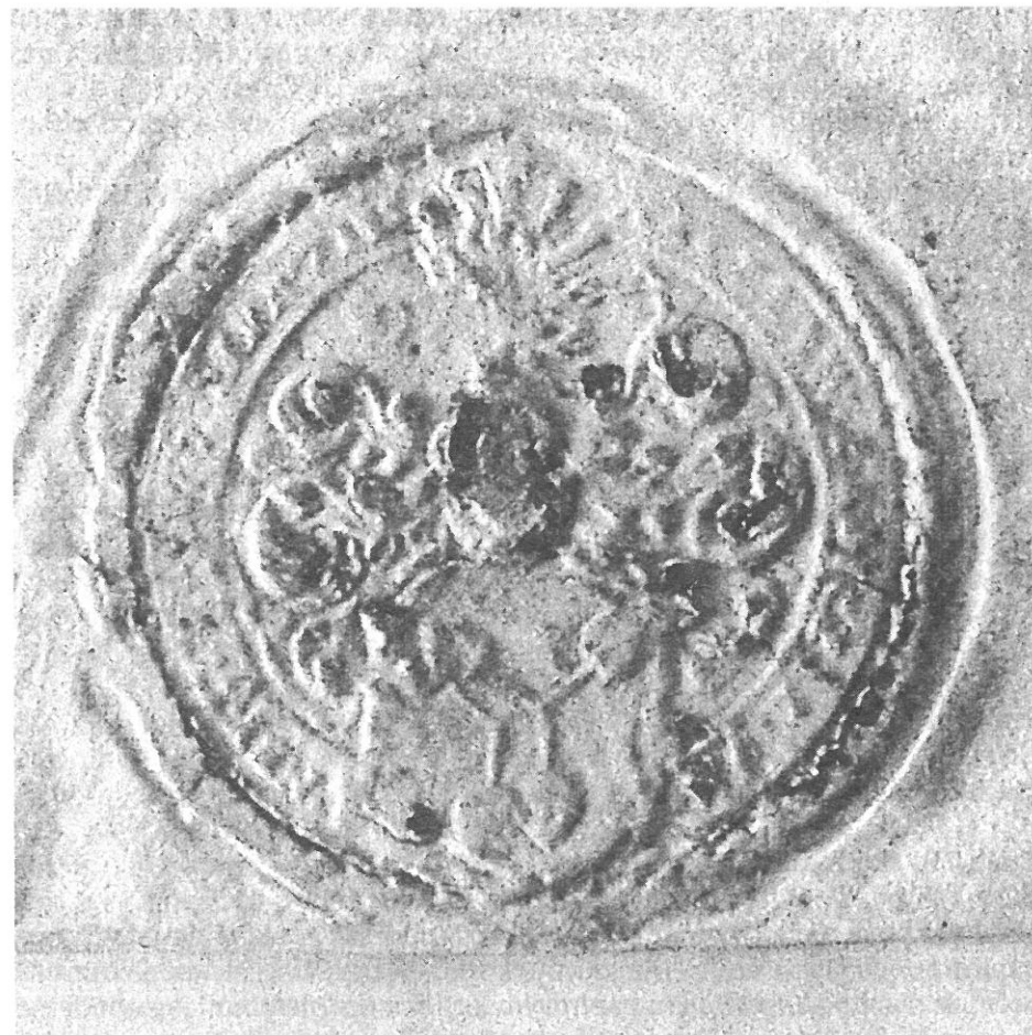
VÁCLAV NA HOŘOVICÍCH, 1594 (č. 77)

Popis erbu: Erb je plný. Obrazové pole měří 24x30 mm.