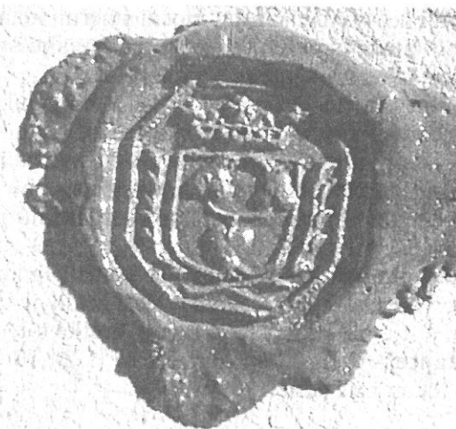
ANNA TEREZIE PROVD. WALLIS, 1722 (Č. 98) SÚA Praha, foto Marie Opatrná

Štít: Španělský, s tenkými okraji, nese trojlíst s listy ve tvaru oboustranně špičatého oválu s tenkými, vysokými