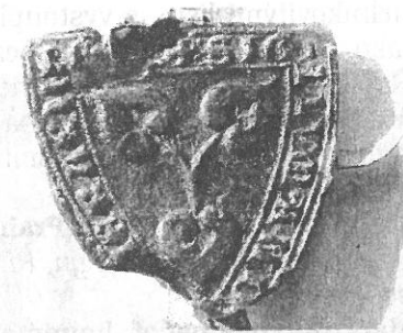
ONDŘEJ ZE VŠECHROM, 1266 (Č. 1) SÚA Praha.

Malá znaková pečeť Jimrama z Průhonic a z Říčan (jako pisatele) je přivě-