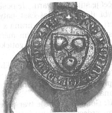
JIMRAM Z PRŮHONIC, 1353 (Č. 3)

Majitel: Jimram z Průhonic a Řičan. Přestože pečeť není stejná jako číslo 2, jedná se o stejného majitele.