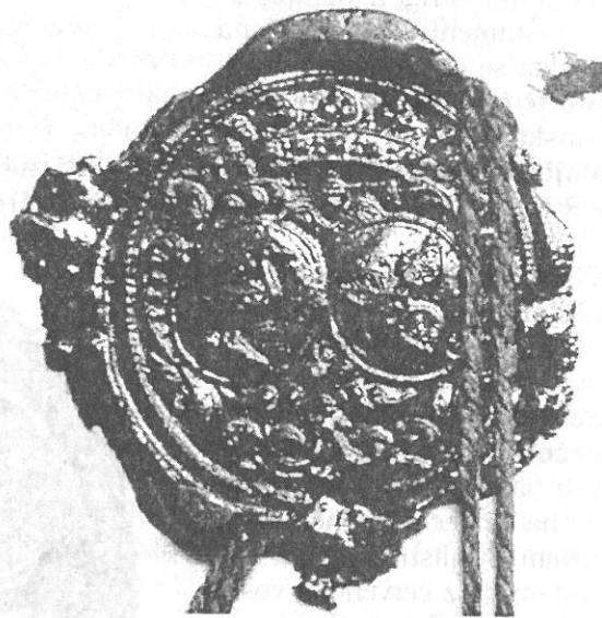
TEREZIE ELEONORA PROVD. DEYMOVÁ. 1750 (Č. 100)

Terezie Eleonory Deymové ze Stříteže rozené z Říčan (jako vydavatelky) je umístěna na sedmé straně německy psaného papírového dvojitého dvojlistu testamentu jako první ze čtyř pečetí pod sebou. Je z černého vosku, ostatní tři jsou červené. Pod nimi je dvojitý provázek spojující dvojlisty. Uprostřed pečeti jsou dva oválné štíty vrchní částí nakloněné k sobě. Nahoře jsou spojené stuhou, okolo mají pětosiřperí, dole ve dvou prolomených řadách. Nad erby je společná koruna, 8-12 mm široká. Zřetelná je celá čelenka, včetně protějššího vnitřního kraje. V ní pět kamenů, mezi nimi jsou vždy dva menší kameny nad sebou. Nad čelenkou jsou tři a dva a půl trojlístu a dva trojúhelníky mezi celými trojlísty.