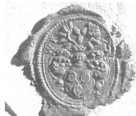
RUDOLF VÁCLAV, 1717 (Č. 53) SÚA Praha, foto Marie Opatrná

Štít: Francouzský, s prohnutými rohy, nese trojlíst se středně velkými, mandlovitými listy, které mají