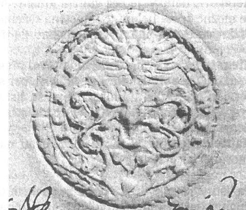
PAVEL NA DUBU. 1619 (Č. 39)