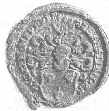
SEBESTIÁN NA PŘESTAVLCÍCH. 1574 (Č. 35) SÚA Praha, foto Marie Opatrná

Štít: Je nakloněný doleva, prohnutý (pravá strana prohnutá, levá vypouklá), čtvercovitý, se spodními zakulacenými rohy. Trojlist s listy malými, spíše trojúhelníkovitými. Spodní je nedotisklý, bez vnitřní kresby. Horní listy směřují do svých rohů, v důsledku tvaru štítu tedy pravý list leží na boku, zatímco levý je kolmo. Spodní list je vpravo mimo osu horních listů i štítu. Řapíky jsou tenké, uprostřed spojené. Levý horní prohnutý doleva, pravý tvořící otevřené, doleva nakloněné Z. Spodní je delší, mírně prohnutý doprava.